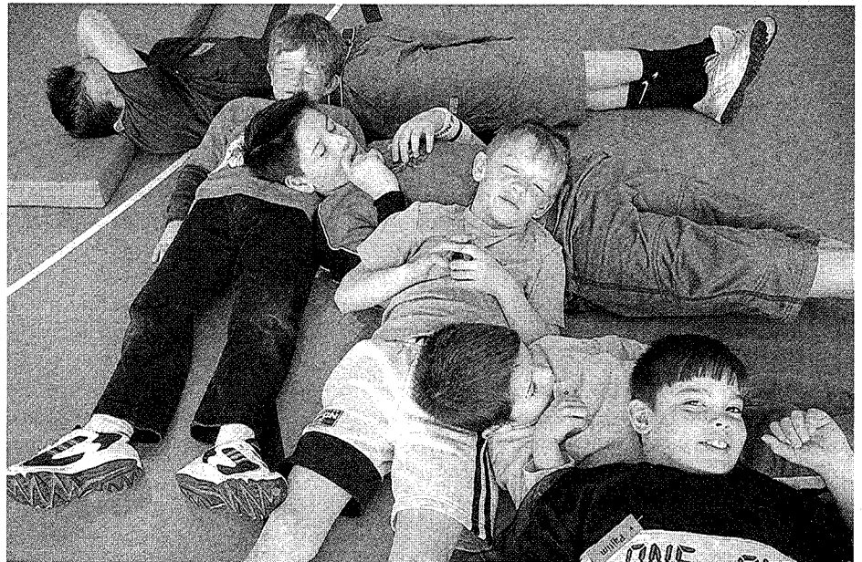
Auch stille Momente können angenehm sein. Gemeinsames Entspannen, bei dem versucht wird, den Atemrhythmus des Schülers, auf dem der Kopf liegt, zu übernehmen.

Martignon: In England werden die Schülerinnen und Schüler für den Mathematikunterricht in der 9. und 10. Klasse jetzt in einigen Privatschulen getrennt. Das ist eine Konsequenz dieser ganzen Debatten. Ich persönlich bin dagegen. Ich bevorzuge das finnische Modell, also eine gut gemischte Klasse, die