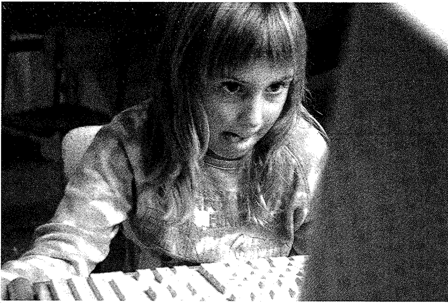
Technische und handwerkliche Berufe werden zukünftig mehr gewählt, wenn in der Schule das technische Selbstverständnis von Mädchen gestärkt wird.