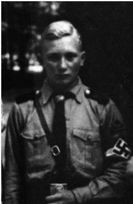
James Krüss als Hitlerjunge in Berlin (1941).

Der Jüngste der drei Großen , Michael Ende, war seit seinem sechsten Lebensjahr im Jungvolk. Als 1943 die Münchner Schulen wegen zunehmender Luftangriffe evakuiert wurden, kam er mit der Kin-