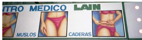
Werbeschild einer Klinik für plastische Chirurgie in Quito/Ecuador (April 2003)

„Bluten für die Schönheit ist groß in Mode. Eine halbe Million Deutsche lassen sich pro Jahr auf dem OP-Tisch verschönern – Tendenz steigend.“ (Enders & Krasser 2004, S. 17).