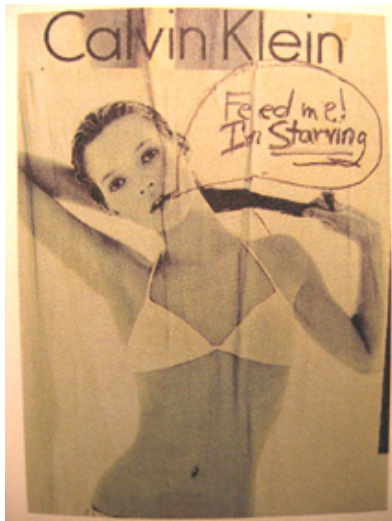
Aus: Gleitman 1995, S. 79.

„The Boston organization Boycott Anorexic Marketing is a group of women who believe that the glamorisation of ultrathin models in advertising tends to encourage the development of eating disorders in young women.“ (Gleitman 1995, S. 79).