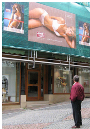
Fußgängerzone in Schwäbsch Hall (September 2004; P. Holzwarth)

Es ist davon auszugehen, dass Darstellungen von körperlich attraktiven Menschen in visuellen Botschaften nicht nur die Körperwahrnehmung und Attraktivitätseinschätzung der Adressaten in bezug auf sich selbst beeinflussen, sondern auch in Hinblick auf die Wahrnehmung von anderen Personen. Möglicherweise orientieren sich Kriterien der Partnerwahl (bzw. Freundschaftswahl) bis zu einem bestimmten Grad auch an den Bildern, die durch visuelle Botschaften als Orientierungsnorm gesetzt werden. Goffman ist zu dem Ergebnis gekommen, dass durch Vorbilder der Werbung Geschlechterrollen typisiert werden (Goffmann 1981).