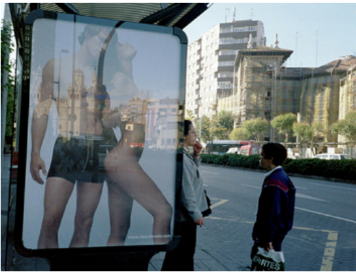
Bushaltestelle in Gijón, Spanien (November 2002)

„The Boston organization Boycott Anorexic Marketing is a group of women who believe that the glamorisation of ultrathin models in advertising tends to encourage the development of eating disorders in young women.“ (Gleitman 1995, S. 79).