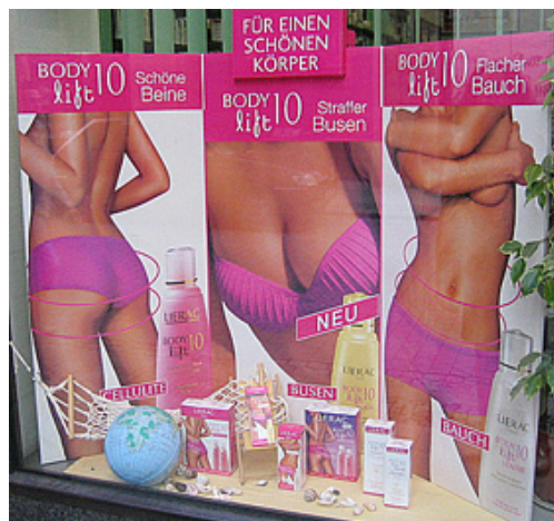
Apothekendisplay in Leipzig (August 2004)

Es ist der Werbung bzw. dem kapitalistischen Wirtschaftssystem zum Vorwurf zu machen, dass die Suche nach Identität und Orientierung ökonomisch ausgebeutet wird.