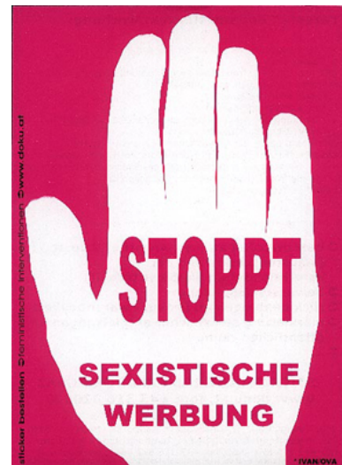
Protestaufkleber aus einer Berliner Buchhandlung (September 2004; feministische Interventionen; http://www.doku.at )

Abschließend stellen sich folgende Fragen: Wie kompetent, aktiv und widerständig ist das rezipierende Subjekt? Was machen die Menschen mit den (Ideal-)Bildern, die sie umgeben? Was machen die (Ideal-)Bilder mit dem Wahrnehmen und Welterleben der Menschen? Wie kann das Verhältnis von Subjekt und Medienkommunikation im Spannungsfeld von Selbstbestimmung (Stichwort „active reader“) und Fremdbestimmung (Stichwort „Entfremdung und „Kulturindustrie“) gefasst werden, ohne in unrealistischen Optimismus bzw. Pessimismus zu verfallen? 8 Wird der Zusammenhang von medialen Idealbildern und Wahrnehmungsprägung überbewertet oder unterbewertet? Besteht gesellschaftlicher und politischer Handlungsbedarf? Welche Gegenkräfte sind aktiv (z.B. politische Kunstprojekte (Protest gegen Ökonomisierung des öffentlichen Raums), kritische Interventionen (s. Aufkleber „STOPPT SEXISTISCHE WERBUNG“, „Adbusting“)?