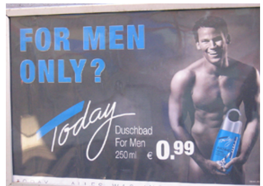
Supermarktfassade in Tübingen (September 2004)

Gemäß Buddemeier knüpft die Werbung an die großen Sehnsüchte der Menschen an (z. B. Freiheit, Liebe, Selbstverwirklichung), weckt Hoffnungen, um dann auf ein Gebiet umzulenken, auf dem es nur kurzfristige Befriedigung geben kann (z. B. sexuelle Wünsche). Bezüglich dieses Gebietes wird ein Bedürfnis geweckt, dessen ersatzweise Befriedigung durch den Konsum des Produktes nahegelegt wird (z. B. Konsum von Zigaretten) (Buddemeier 1981, S. 151 f.).