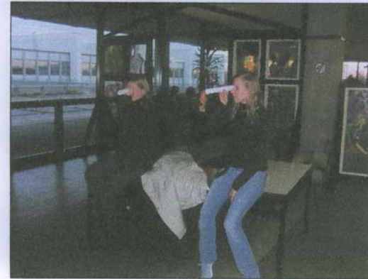
Bild 1: Unser erstes Teilprojekt zu Beginn des Semesters, eine etwas andere Wahrnehmung durch ein Papierrohr

Bilder, die während des Seminars und des Filmprojekts entstanden sind