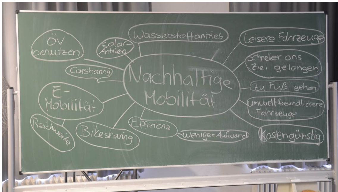
Die Teilnehmerinnen und Teilnehmer machten sich Gedanken, wie die Mobilität der Zukunft aussehen kann.