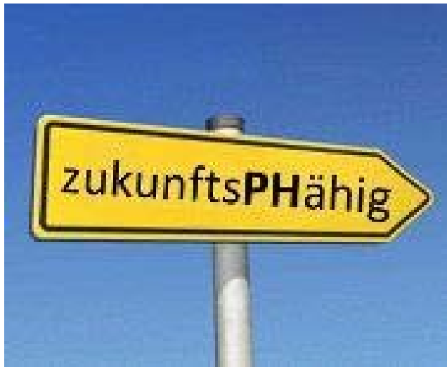
Logo der studentischen Energiesparinitiative