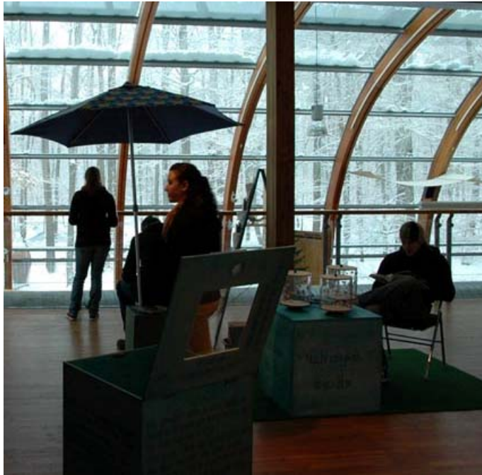
Studenten auf der Exkursion im Haus des Waldes