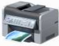
4.108 - Kopierer Ricoh auf SERVNET01