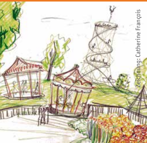
Zeichnung: Catherine François